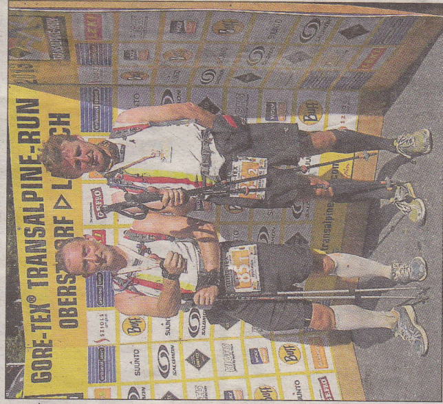
Stolz und erleichtert präsentierten die Läufer ihrer Transalpine-Medaille Nummer 3 den Fotografen im Ziel.