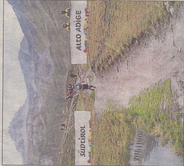
Ohne größere Grenzkontrollen geht die Ein- und Ausreise zwischen den vier Ländern vonstatten – hier geht es gerade nach Italien.

che körperlicher Verschleißerscheinungen während des Rennens. „Man muss extrem trittsicher und schwindelfrei sein, um einigermaßen problemlos durch das Rennen zu kommen“, stellt Peters klar. Geschlafen wird mit gut 200 Mitstreitern in Turnhallen – wenn man dazu überhaupt in der Lage ist. Dazu steht jeden Abend ein kohlenhydratreiches Nudelgericht auf dem Speiseplan. Mit Komfort ist nicht zu rechnen, sagt Peters. Es ist wohl nicht nur eine Prüfung von physischer, sondern auch mentaler Stärke.